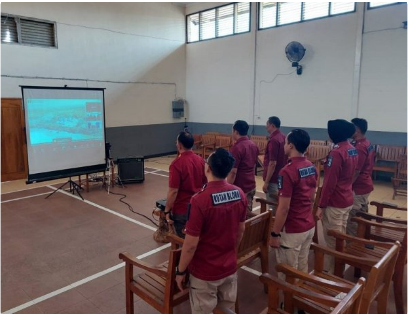
Rutan Blora Ikuti Webinar Series 5 Bersama BPSDM Hukum dan HAM

Blora – Rumah Tahanan Negara (Rutan) Kelas IIB Blora Kantor Wilayah Kementerian Hukum dan Hak Asasi Manusia (Kemenkumham) Jawa Tengah