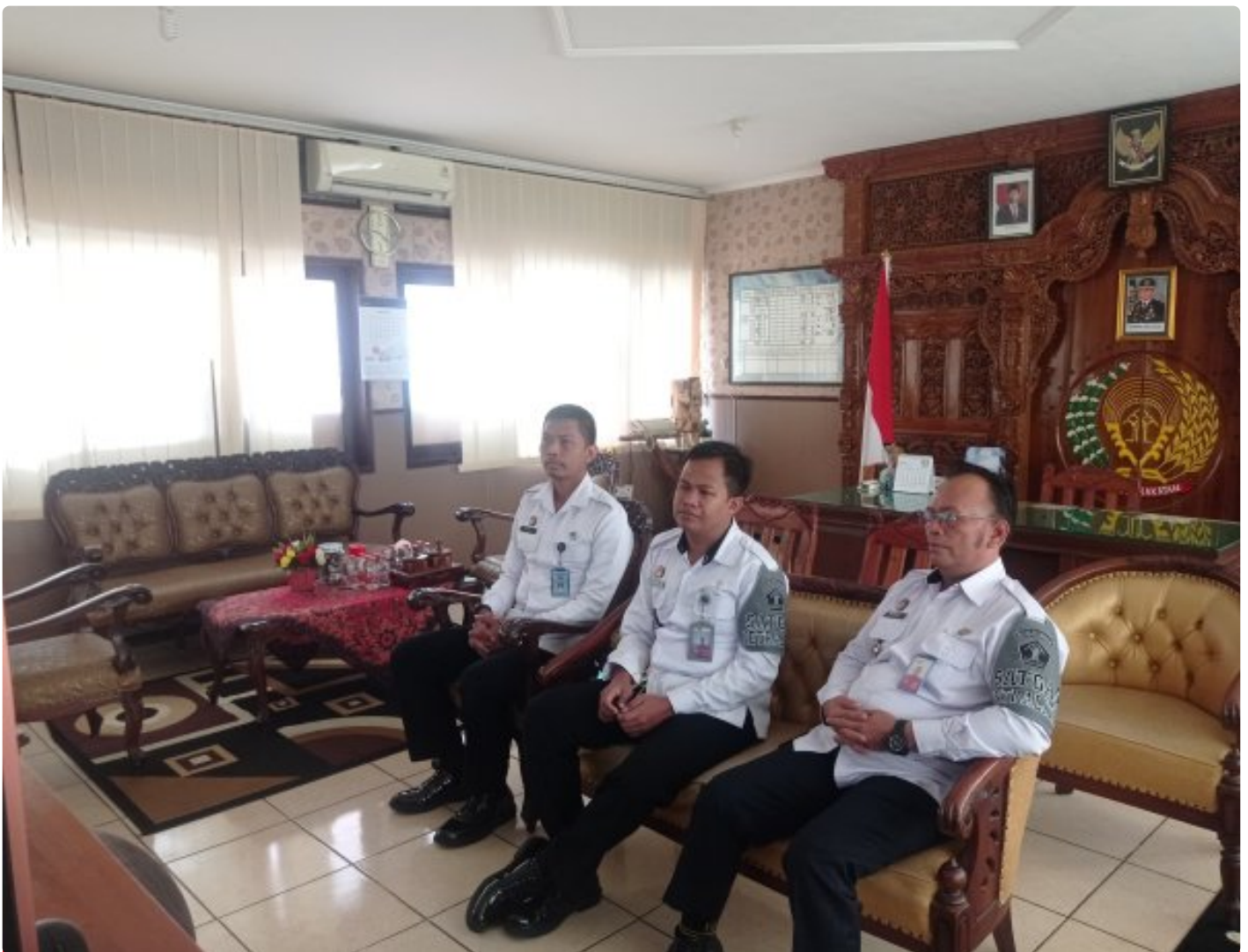
Rutan Blora Bergabung Dalam Giat Zoom Reformasi Birokrasi